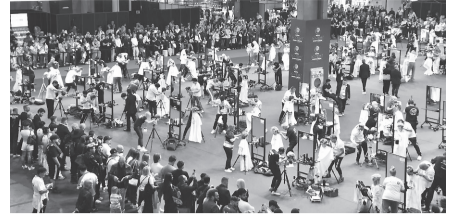
昨年の世界大会の様子

12日)に24歳未満であること。 選手への助成: マネキン2体、出場時の支援金15万円。