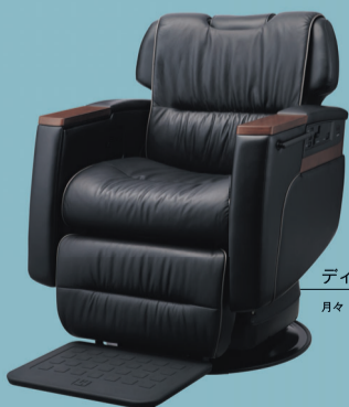
ディヴァーン-Z 月々17,100円~