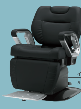
イノーヴァ EX 月々9,500円~

※表示価格は2026年4月現在の税抜価格です。詳しくは当社営業担当までお問合せください