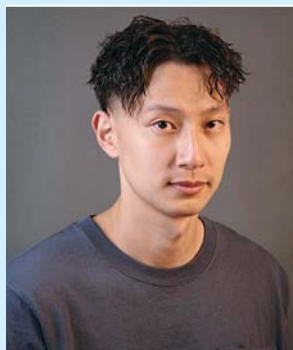
DONG/HUEI JR (台湾)