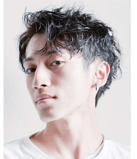
2023 クールビズヘア最優秀スタイル