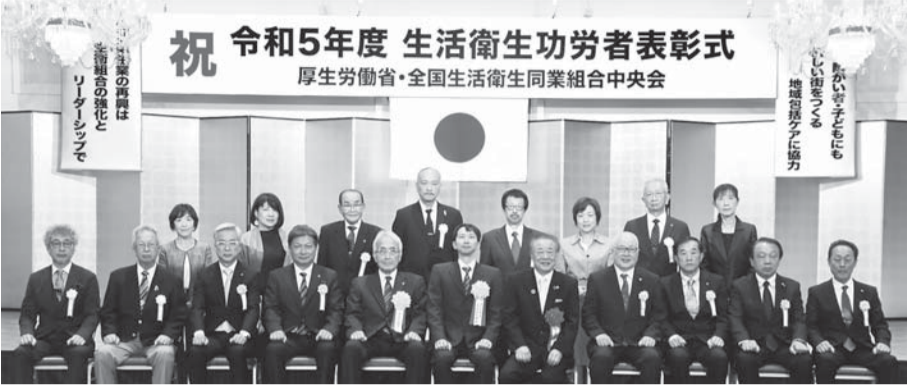
祝 令和5年度 生活衛生功労者表彰式 厚生労働省・全国生活衛生同業組合中央会