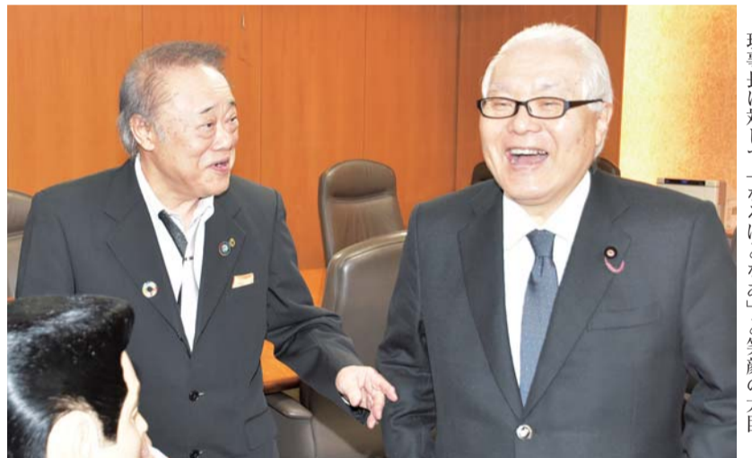
ヘアスタイルづくりのポイントを説明する大森理事長に対して「なるほどなあ」と笑顔の大森

武見敬三大臣は、ナショナルチーム関係者全員が寄せ書きをした日の丸旗にサインしたほか、日本の理容はすごいとは聞いていたが、ヘアデザインのすごさに驚くとともに作品づくりについての質問とねぎらいの言葉をかけていた。