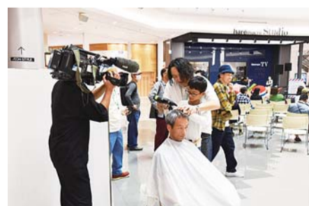
中国協議会 (岡山会場)