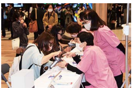
東北協議会 (仙台会場)

けたと手ごたえを感じています」と述べ、大森理事長も「業界の業績回復につなげてもらおうと、各開催地でイベントを企画している。マスコミとタイアップすることにより、地元ラジオ局の公開放送が組まれるなど社会へのアピールも効果的に行えていると思う。シェーブメイクやセルフ脱毛メニューなど理容師向けにセミナーも行っており、取り組めるものから営業に活用してほしい」と語っている。