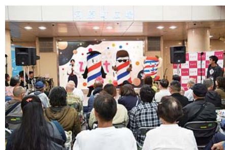
近畿協議会 (京都会場)